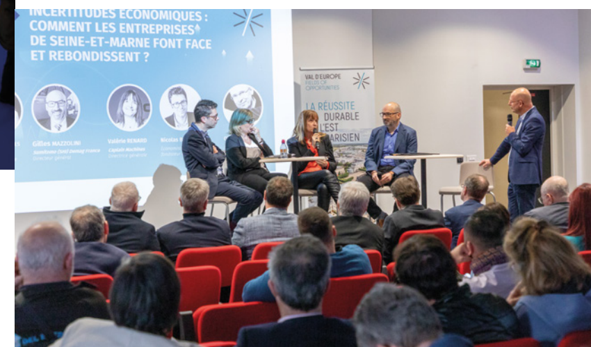
* Conférences, débats, tables rondes... pour avancer collectivement