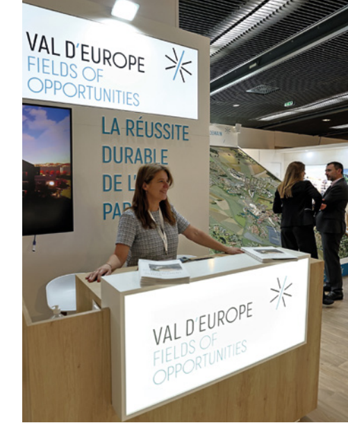
* Val d'Europe à la conquête des investisseurs lors du Salon de l'Immobilier d'Entreprise (SIMI)

Rejoindre notre démarche d'attractivité, c'est vous inscrire au sein d'un réseau de partenaires, pour développer votre business et faire rayonner votre entreprise, sur notre territoire et au-delà !