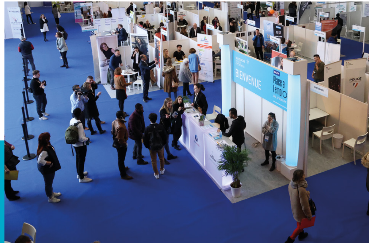
* "Place à l'emploi", le salon dédié à l'emploi, la formation et l'insertion professionnelle