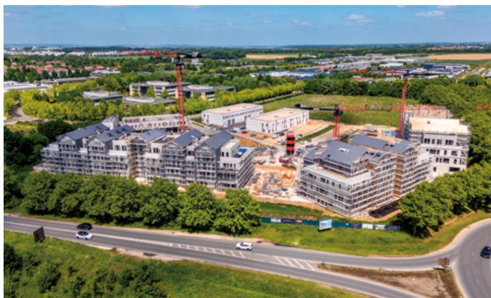
Parc International d'Entreprises, West Park

Le territoire connaît un développement sans précédent. Résilient face aux défis, il poursuit son évolution en harmonie avec les aspirations de la ville de demain : accueillante, innovante et durable