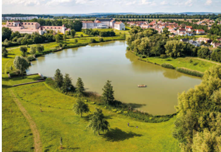
Étang des Colverts, Magny le Hongre, Quartier Val de France