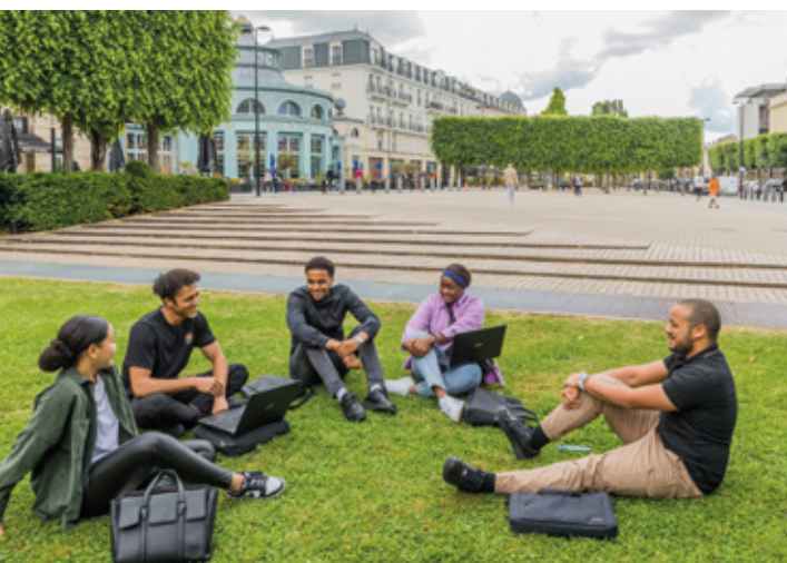
Vie étudiante du Centre urbain

Le territoire connaît un développement sans précédent. Résilient face aux défis, il poursuit son évolution en harmonie avec les aspirations de la ville de demain : accueillante, innovante et durable