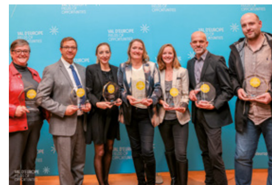
Lauréats des Trophées Économiques 2025

* Source : Ipsos - Attractivité de Val d'Europe 2024